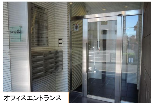
オフィスエントランス